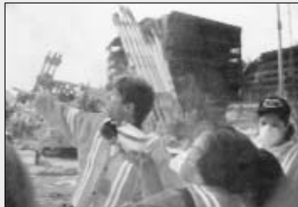
Az Amerikai Bibliatársulat önkéntesei a WTC romjai mellett

A szeptember 11-i New Yorkban történt terrortámadás után a tragédia színhelyétől csupán néhány háztömbnyire működő Amerikai Bibliatársulat azonnal reagált a történetekre. Pillanatok alatt elkészítették az Isten a mi menedékünk és erősségünk című válogatást, vigasztalást és bátorítást nyújtó bibliai igékből. Néhány nap alatt több, mint egymillió példány füzetet osztottak szét a kétségbeesett emberek között. Később nyilvános imádságokat szerveztek helyi