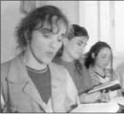
Elítéltek bibliaolvasás közben egy romániai börtönben

pet és jót egyszerre jelent. Amikor pedig Pál a korinthusiak Jeruzsálembé küldött adományáról beszél, a kháriszt említi, ami nem csupán az isteni kegyelmet idézi emlékeztünkbe, de a „szép, kecses, vonzó” gondolatát is... Csak ráadás, hogy Pál a filippi gyülekezet adományát is „kellemes illatnak” és „kedves áldozatnak” nevezi (Fil 4,18). Az adakozás akkor szép és jó, ha valódi szeretetet és együttérzést fejez ki. Ha így adakozunk, válaszolunk Krisztus élet-áldozatára, aki „gazdag létére szegénnyé lett értünk” (2Kor 8,9). A keresztyén ember adakozása nem „mellékes” dolog, hanem nemes és vonzó cselekedet, amely kicsiben visszatükrözi Isten övéi iránt érzett forró szeretetét. Ez a szeretet átlép a faji és társa-