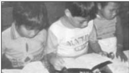
Burmai kisgyerekek olvasni tanulnak

A Bibliatársulatok Világszövetsége (UBS) jelenleg 27 országban vesz részt az írástudatlanság elleni küzdelemben. Ebből a célból 34 különböző nyelven bibliai olvasókönyveket osztanak szét, főként kisgyermekek között. Az akció összköltsége mintegy 2 millió dollár. Ezt az összeget a Magyar Bibliatársulathoz hasonló nemzeti bibliatársulatok teremtik elő, felajánlások és kiadványaik árusítása révén.