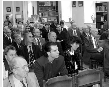
Az érdeklődők előadásokat hallgatnak a Ráday Könyvtár olvasótermében

A Magyar Bibliatársulat és annak tizenkét taggyháza számára a kettős évforduló kiváló lehetőséget teremtett az összegző-értékelő visszatekintésre és egyben indokot a jövő feladatainak megfogalmazására is. Kétnapos ünnepségsorozattal emlékeztünk meg az új fordítású Bibliáról és hatásáról a legutóbbi évek magyar protestantizmusában, a korábban kevésbé meg- és elismert fordítókról, teológiai tanárokról