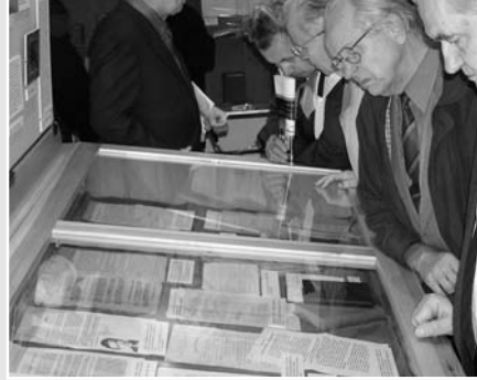
A Biblia Múzeum tárlói között