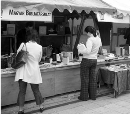
A Magyar Bibliatársulat standja a Protestáns Kulturális Fesztiválon, Debrecenben

30 évvel ezelőtt, 1975-ben jelent meg a protestáns új fordítású Biblia, 15 évvel később, 1990-ben pedig annak javított kiadása. A két időpont óta eltelt időszakban az új bibliafordítás eljutott a bibliaolvasó keresztyének legszélesebb rétegeihez, ma már – ha (el)ismertségében még nem is, de az eladott példányszámokat tekintve népszerűségé-