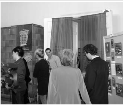
A Bibliatársulat rögtönzött bibliakiállítása a debreceni Kollégium épületében, október 29-én

ben mindenképpen – a Károlyi-fordítás méltó örökösének bizonyult.