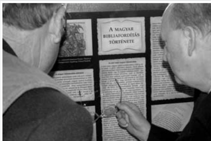
Országjáró bibliakiállítás Celldömölkön

A 2008. évi adománygyűjtő akción az ökumenikus imahét megnyitó istentiszteletén és az imaheti tájékoztató füzetben már meghirdetett általános célunkhoz kapcsolódik: a magyarországi pszichiátriai intézetekben, illetve a kórházak ilyen jellegű osztályain szolgáló lelkészeket ajándékozzuk meg Bibliákkal, evangéliumi füzetekkel, Újszövetségekkel vagy más bibliai szövegválogatásokkal. Mindannyian jól tudjuk, hogy az egyébként is igen mostoha körülmények között működő hazai egészségügynek mennyi sajátos nehézséggel