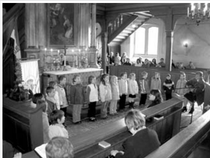
Bibliai történetek, Celdömölk