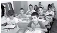
Bibliaosztás az Orosházi Református Általános Iskolában

2014 nyara óta számos bibliaosztást végeztünk, összességében mintegy 3 millió forint értékben, elsősorban az általános és középiskolás diákok között és a kisebb, még támogatásra szoruló missziói gyülekezetekben. A református egyház kezdeményezéséhez, amely a kilencedikes gimnazistákhoz juttatja el a Bibliát határon innen és túl, a Bibliatársulat ebben az évben ezer Bibliával járul hozzá.