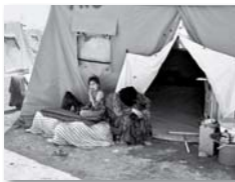
Iraki keresztény menekültek egy táborban

resztyének története: Egyiptomban és Irakban is egykor mintegy százezer főt számláló zsidó diaszpóra élt, ma gyakorlatilag nem élnek zsidók egyik államban sem. Félő, hogy ez a sors várhat a keresztényekre is.