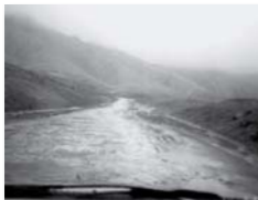
Úttalan utakon Irak északi részén, télidőben

rezsím ellen lázongások kezdődnek vagy éppen megbukik, az könnyen a kereszténynek elleni népharag felerősödéséhez vezethet.