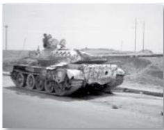
A harcokban hátrahagyott kilőtt tank, amelyet a gyerekek játszótérnek használnak

Jelenleg az is igencsak kétségesnek látszik, hogy a „nyugati kereszténység”, és benne mi magyar keresztények mi- ben tudunk segíteni üldözött keleti keresztény testvéreinknek. A nyílt külföldi támogatás sokszor csak rontja a helyi keresztények helyzetét, mert feldühíti és ellenük hangolja a helyi nacionalista vagy radikális iszlamista csoportokat. A nyugati államok az utóbbi időben megpróbálkoztak azzal is, hogy politikai vagy katonai segítséget adjanak azoknak a szekuláris politikai pártoknak, mozgalmaknak, amelyek az adott országban „iszlámmentes” világi ideológia bevezetését ígérték hatalomra kerülésük esetén. Ez mindig azzal a veszéllyel járt, hogy a keresztények neve egy bizonyos politikai rezsimhez kötődött az adott országban, mint ahogyan az Irakban történt a szocialista Ba'ath párttal vagy Aszad elnök rezsimjével Szíriában. Ha a