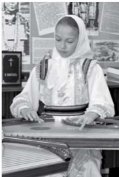
Hangszerén játszó lány a hegyi mari nyelvű Újszövetség ünnepélyes bemutatóján

A mari (más néven cseremisiz) emberek kétféle frott nyelvet használnak, az orosz mellett mindkettő hivatalos nyelvnek számít az Oroszországhoz tartozó Mari Köztársaságban. Bár a többség az ún. mezei mari nyelvet beszéli, Mariföld