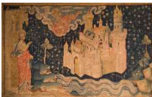
János látomása az új Jeruzsálemről egy 14. századi falikárpiton

25. (FILM) A kisfilm Jézus visszatéréssel zárul, amikor a menny és a föld újra tökéletes egységbe kerülnek: A jelenések könyvében van egy gyönyörű kép az Éden kertjéről, de egy _____ formájában, ami véget fog vetni a bűn és a halál korszakának az egész emberi történelem megváltásával, egy megújult teremtésben – és Isten tere és az ember tere újra teljesen egyek lesznek. Mi a hiányzó szó?